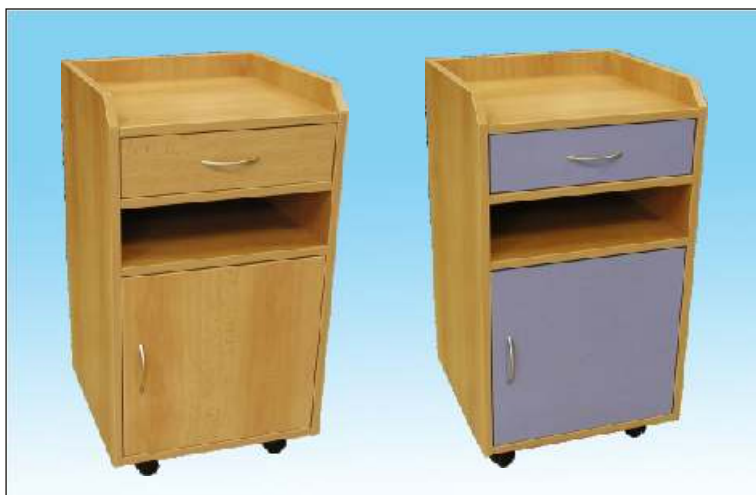
No ní stolek s nikou