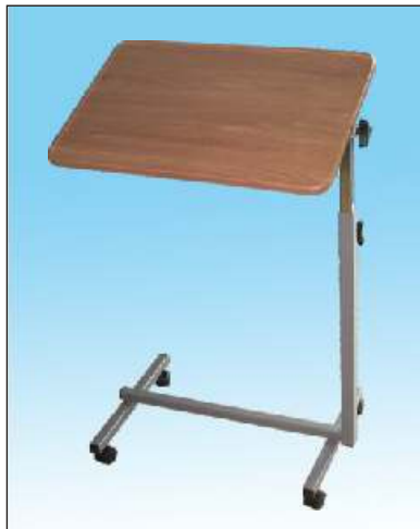
Stolek k lůžku ECO