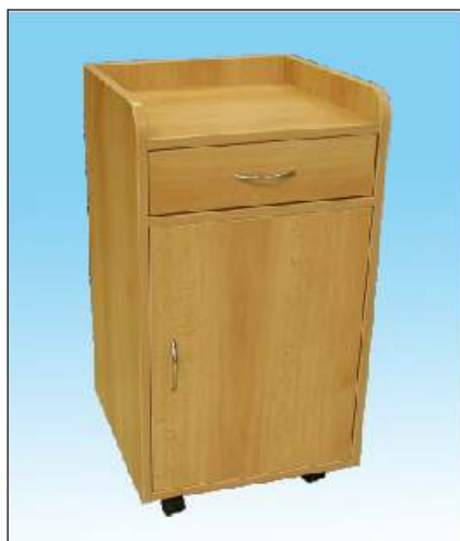
No ní stolek bez niky