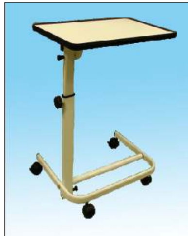
Stolek k lůžku